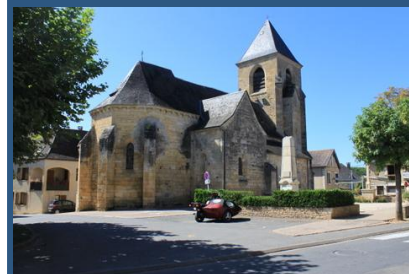
De kerk in St Julien de Lampon

'.....de penetrante geur die er met vlagen af kwam...'