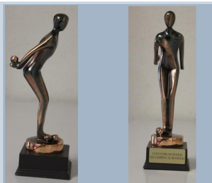
De trofee voor de winnaars van de jeu de boules wedstrijden (ze mogen 'm even vasthouden)