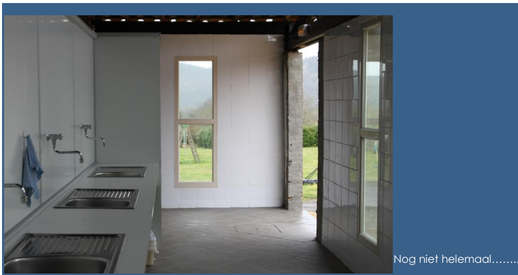
Nog niet helemaal.....